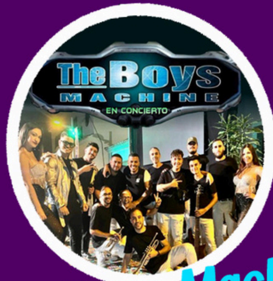
The Boys Machine Tenerife