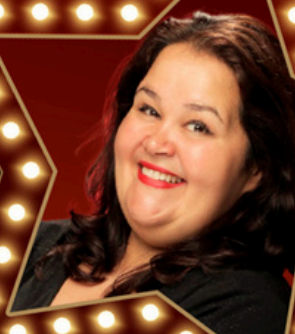
Pily Soy yo