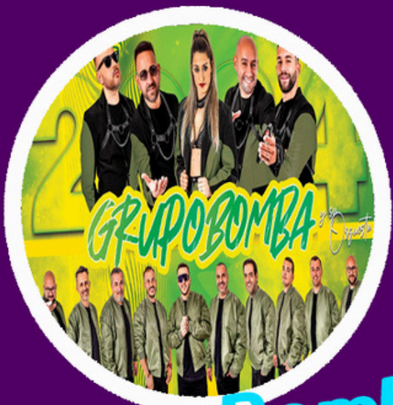
Grupo Bomba Fuerteventura