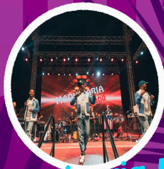
Maquinaria Band Tenerife