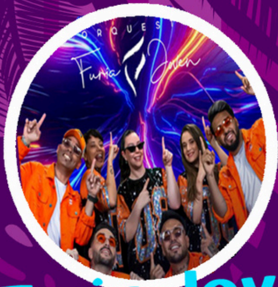
Furia Joven Gran Canaria

DE 15:00 A 04:00 H. + DE 12 HORAS DE MUSICA SIN PARAR!